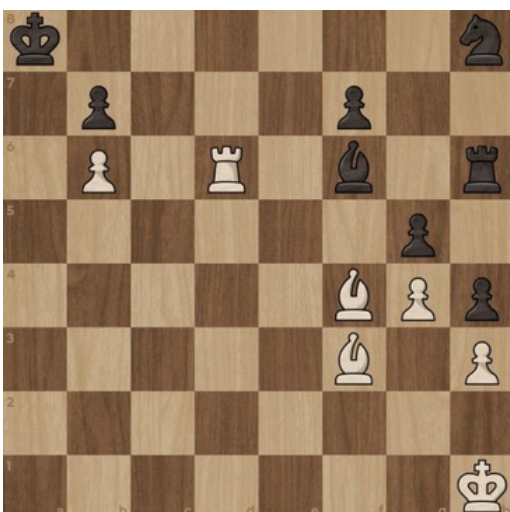
5. Mat w 3