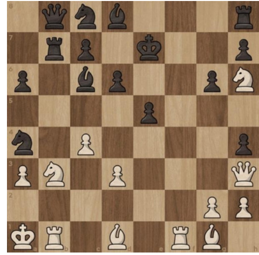
6. Mat w 6