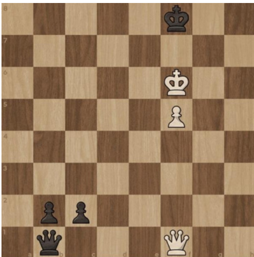
3. Mat w 2